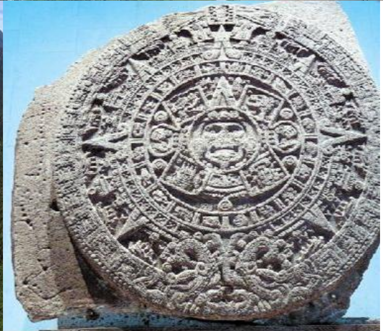
Λιθινή εγχάρακτη στήλη των Μάγιας, στο κέντρο της οποίας απεικονίζεται ο Ήλιος